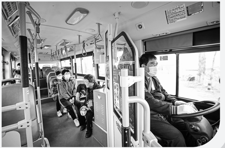
▶近日，司机驾驶“网约公交车”运送乘客出行。