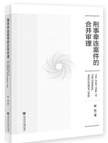
《刑事牵连案件的合并审理》崔凯著 社会科学文献出版社

全书既探索究竟推进全过程人民民主的法律实施与法治保障，完善中国式现代化的制度体系建设，又以“创造人类民主文明新形态”为落脚点，通过对“全过程人民民主”这一中国式现代化民主文明形态进行理论解构，揭示其为世界提供中国式民主方案，为人类文明的进步与发展贡献中国智慧。