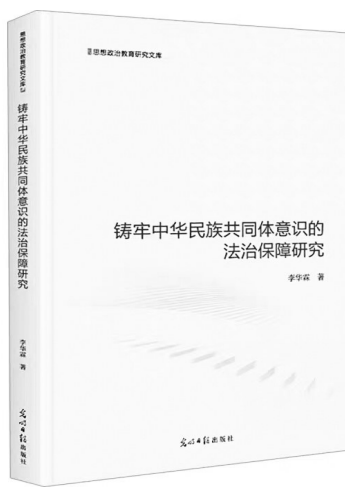
《铸牢中华民族共同体意识的法治保障研究》 李华霖 著 光明日报出版社

国家安全是民族复兴的根基,社会稳定是国家强盛的前提。本书从理论与实践两个维度入手,旨在深入探讨国家安全学作为理论支撑如何在新时代更好地维护与塑造国家安全。2024年恰逢总体国家安全观提出十周年,特推出此书,向总体国家安全观提出十周年献礼。作为一本跨学科的专业著作,本书不仅有深厚的学理基础,还具有极强的现实针对性和实践指导性。它对社会各界普遍关注的安全问题进行了细致且富有启发的剖析,以小见大、见微知著,也让国际社会更清晰地了解与时俱进的中国国家安全学说以及政策意义、理念价值、实践伟力。