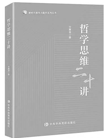
《哲学思维二十讲》宋惠昌著 中共中央党校出版社

本书以习近平总书记关于坚持和完善人民代表大会制度的重要思想为统领，聚焦人民代表大会制度的丰富内涵，全面阐释了人大代表制度、组织制度、选举任免制度、立法制度、监督制度、讨论决定重大事项制度、会议制度和工作制度，全方位回答了人大代表、人大机构、人大职权、人大会议、人大工作的基本问题，深入阐述了习近平总书记关于立法和监督的重要论述，根本政治制度的发展历程、人大工作的创新发展，具有简明、规范、系统、权威的特点，是帮助各级人大代表、人大干部提升专业理论水平不可多得的好读物，同时也是社会公众全面了解我国根本政治制度的好教材。