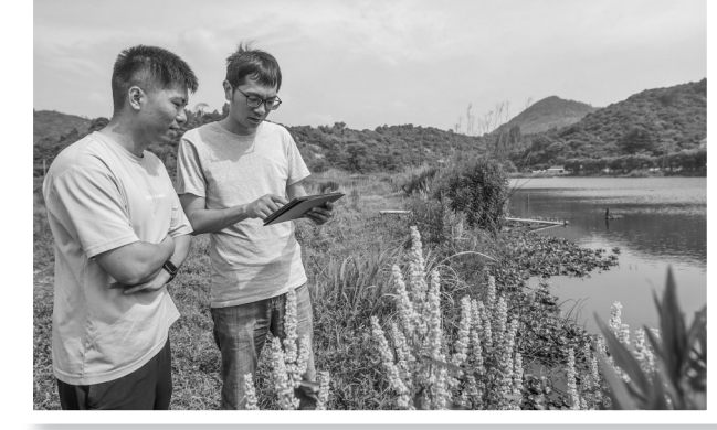
近年来,浙江省慈溪市积极推进“和美乡村规划师”制度。乡村规划师从专业角度出发,结合实地勘察与调研成果,参与结对乡镇的未来乡村建设规划、乡镇科学布局新兴产业规划、乡村风貌提升规划等实施策略的讨论和研究。