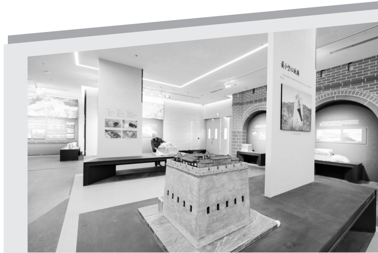
4月11日,工人在山海关中国长城博物馆展厅布展。