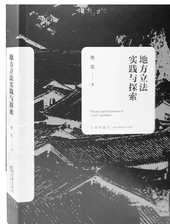
《地方立法实践与探索》 熊震著 法律出版社

本书运用古今中外比较研究法,深入探究和科学论证中国特色社会主义来源于科学社会主义,是建设社会主义现代化强国、实现中华民族伟大复兴的正确道路。并以道路自信、理论自信、制度自信和文化自信为基础,进一步拓展和深化了对中国特色社会主义与人类文明新形态研究。本书在世界观、方法论层面,通过深入探索和论证中国共产党执政规律、社会主义现代化建设规律和人类社会发展规律,深刻阐明中国共产党领导中国人民创造中国式现代化新道路、创造人类文明新形态的原创性贡献和世界历史意义。本书对新时代进一步坚持和发展中国特色社会主义、坚定不移不移走中国式现代化新道路、创造人类文明新形态具有重大现实意义。