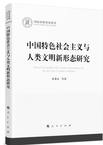
《中国特色社会主义与人类文明新形态研究》 袁秉达等著 人民出版社

本书从坚持全党最基本的政治底线不动摇、守住我国经济可持续发展的底线、让老百姓过上好日子是一切工作的出发点和落脚点、时刻保持解决大党独有难题的清醒和坚定、常讲政德坚守底线、严守纪律不触红线六大方面,系统阐释了在进一步深化改革开放推进中国式现代化的新征程上必须坚守的底线,以及应对各项重大风险考验的重要理论和实践问题,透彻讲解了党员干部如何树牢政治、经济、民生、执政、道德、纪律方面的底线思维,统筹推进高质量发展和高水平安全的实践方法。本书说理透彻,分析全面,方法实用,是广大党员树牢底线思维、增强防范化解风险本领的重要参考书。