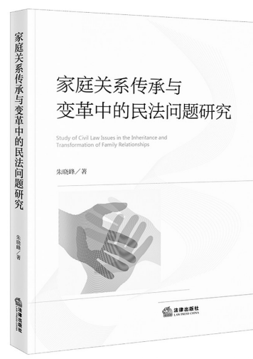
《家庭关系传承与变革中的民法问题研究》 朱晓峰著 法律出版社

本书以1840年鸦片战争以来,中国人民和无数仁人志士孜孜不倦寻找适合国情的政治制度模式却屡遭失败的惨痛教训为背景,力图全景式展现中国共产党领导中国人民夺取中国革命胜利,创造具有中国特色、中国风格、中国气派的人民代表大会制度的艰辛历程和伟大贡献。