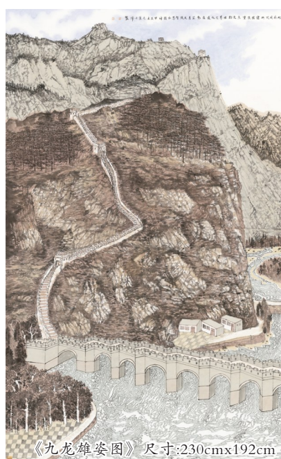
《九龙雄姿图》尺寸:230cm x 192cm 2024年