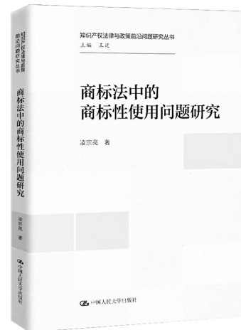
《商标法中的商标性使用问题研究》凌晓亮著 中国人民大学出版社

本书是作者20年来律师和仲裁实践经验及研习证据法的一个总结，在编写风格上，打破传统概念、特征、分类、意义等的理论性解读，围绕关键问题展开，将相关原理与实务相结合，充分展现证据规则的应用流程，别具一格。