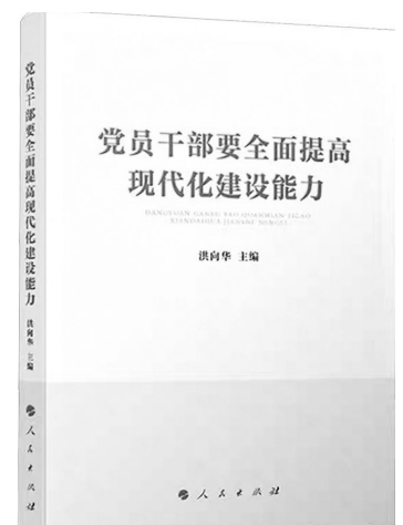
《党员干部要全面提高现代化建设能力》 洪向华 编 人民出版社

本书紧扣实践脉搏,针对民事诉讼中证据运用的热点、难点问题,进行深入剖析与解答。本书的撰写,秉持三个要求:一是通俗易懂,力求用平实的语言阐述深奥的证据法原理,让每一个读者都能轻松读懂;二是结合实务,通过大量真实案例的分析,将理论与实践紧密结合,让读者在案例中领悟证据法的精髓;三是在内容编排上,本书既涵盖了证据法的基本理论,例如,经验法则、司法认知、推定、裁判的效力、自认、举证期限、证据交换、交叉询问、诚信原则、证明责任、证明标准等,又深入探讨了民事证据在实务中的具体应用,例如,常见的离婚案件、交通事故案件、民间借贷纠纷中的证据规则等。这种理论与实践的结合,使得本书既具有学术价值,又具有实用性。