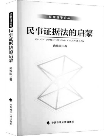
《民事证据法的启蒙》 房保国 著 中国政法大学出版社

本书紧密围绕新修订的治安管理处罚法及相关行政法规,系统梳理治安案件办理的全流程,对该法修订后的法律条文逐条进行阐述,并辅以与相关法律法规之间的对比认定及配套案例,旨在帮助执法人员准确理解法律条文,规范执法行为,提高执法效能,切实维护人民群众合法权益。该书的出版,不仅是对治安管理处罚法修订成果的全面梳理与解读,更是对基层执法实践的深度融合,才能实现社会治理的精细化与人性化。