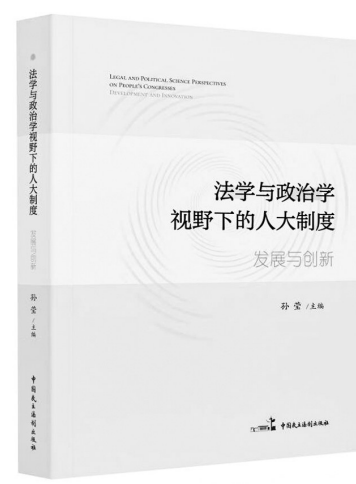
《法学与政治学视野下的人大制度: 发展与创新》 孙莹 编 中国民主法制出版社

当前,我国经济正处于高质量发展的关键阶段。民营企业作为市场经济的重要主体,其健康发展直接关系到我国经济高质量发展的全局。有关方面应以此次典型案例的公布为契机,凝聚预防和惩治民营企业内部腐败犯罪的强大合力,拔除这一侵蚀民营经济健康发展的“毒瘤”,切实保障民营企业合法权益,维护公平竞争的市场环境,助力营造法治化营商环境。