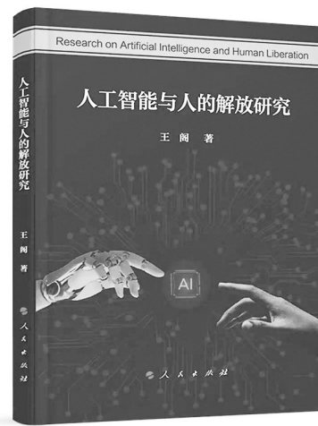
《人工智能与人的解放研究》 王阁 著 人民出版社

人工智能会取代人类吗?人工智能技术奇点什么时候会到来?人工智能越来越像人,如何重新定义人的本质?如何应对人工智能带来的风险挑战……随着人工智能技术的发展,引发了人们一系列的思考。人工智能技术在现实生产生活中的应用最终影响的是人类自身的发展。