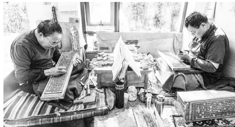
西藏雪巴康雕版印刷制作技艺入选西藏自治区级非物质文化遗产代表性项目名录。图为雕刻师在工作。

党的十八大以来,在以习近平同志为核心的党中央的亲切关怀和全国人民的大力支援下,西藏坚持以人民为中心的发展思想,把人的全面发展摆在重要位置,在教育、医疗、就业等诸多领域持续发力,让各族群众在这片高原热土上共享发展成果。