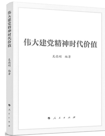
《伟大建党精神时代价值》 吴德刚 著 人民出版社

“一粥一饭,当思来之不易;半丝半缕,恒念物力维艰。”节约粮食是保障国家粮食安全的重要途径,也是我们每个人的义务和责任。全社会应深入贯彻节约粮食的法律法规,凝聚起节约粮食的法治合力,耕好节粮减损“无形良田”,让“中国饭碗”端得更稳更牢。