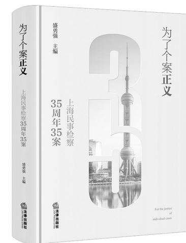
《为了个案正义》 盛勇强 编 法律出版社

全书紧扣人民代表大会制度与全过程人民民主主题,立足海南经济特区、自由贸易港建设实际,围绕立法创新、监督实效、代表履职、民主实践等热点议题,以新闻评论形式生动记录和深入阐释我国根本政治制度的实践探索与时代价值。既有理论深度,又具“海味”特色,堪称一部观察地方人大制度创新的鲜活样本。本书能为从事人大新闻宣传与理论研究的读者,提供一个观察制度运行、提炼民主价值、提升话语表达的珍贵样本。该书填补了人大制度新闻评论书籍的空缺,是深入认识人大制度、了解人大工作不可多得的参考书,更是专业培训、学习指导不可或缺的读本。