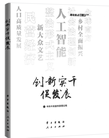
《创新实干促发展》 中共中央宣传部理论局编 人民出版社

再次,有利于推动形成公益保护合力。立法将完善“府检联动”机制,推动信息共享、联合督办制。草案规范完善了诉前程序,规定检察机关提出检察意见及行政机关回复、整改等程序,要求检