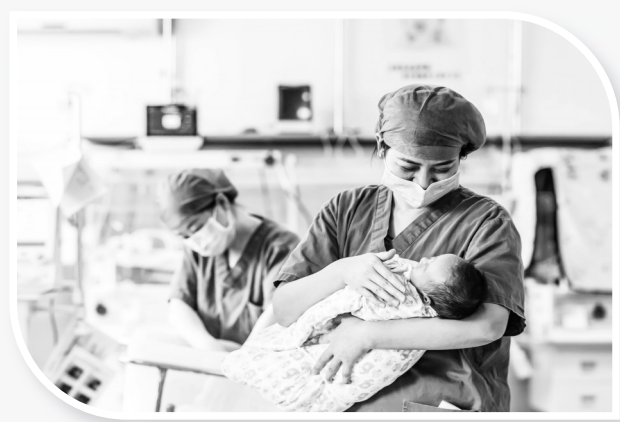
图为医护人员在贵州省黔西市人民医院新生儿科为新生儿做日常护理。