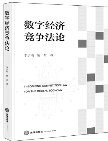
《数字经济竞争法论》李子硕 杨东 著 法律出版社

本书分为上下两编,上编为理论前沿,主要介绍行政协议领域的前沿理论成果;下编为实务指引,聚焦案件争议焦点,对行政协议案件反映出的常见问题加以厘清。全书基于一线审判实践和丰富案例资源,对行政协议理论和实务经验进行全面总结,并选取典型案例展开判例解析,以期对行政协议实践工作发挥参考价值。