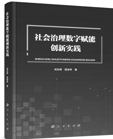
《社会治理数字赋能创新实践》倪东辉 程淑琴 著 人民出版社

最高法的这一批复,直击实践疑点、难点,让原本有些笼统模糊的制度变得清晰可操作,让制度的善意能够顺畅抵达每一位符合条件的参保人。这不仅是法治建设和法律适用层面的进步,更是“坚持民生为大”的理念在司法和社保领域的生动体现。期待相关部门在经办服务中,吃准吃透批复精神,进一步端正理念,优化规则、简化流程、提高效率,切实把好事办好、实事办实。