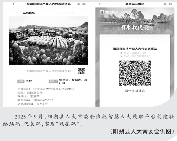
2025年9月，阳朔县人大常委会依托智慧人大履职平台创建联络站码、代表码，实现“双亮码”。