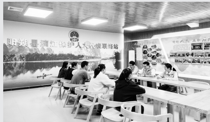
2025年10月，阳朔县漓江保护人大代表联络站代表开展接待群众活动。