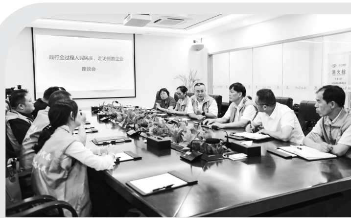
2024年5月，阳朔县旅游行业人大代表联络站代表走访旅游企业。

“这是大自然赐予中华民族的一块宝地，一定要保护好，这是第一位的。”习近平总书记的殷殷嘱托道出了阳朔发展的核心理念。阳朔县人大常委会以阳朔县漓江保护人大代表联络站为依托，立足阳朔发展实际，精准汇聚起漓江保护的民智民力。围绕生态保护、绿色转型，代表们积极建言献策，先后提出了《关于对漓江进行科学治理、有效保护的议案》《关于推进漓江沿岸农村污水处理的建议》等一批高质量建议，推动全县率先完成1000艘纯电动游船排筏全面取代燃油筏，彻底告别燃油污染。随着漓江生态的持续改善，先后涌现出阳朔县白沙镇遇龙村、阳朔镇鸡窝渡村等“网红”村落，吸引了世界各地游客纷至沓来，并且人大代表还主动对接沿岸渔民，宣讲政策、解读扶持措施，引导渔民转型开民宿、做电动排筏工、当“渔模”，成功实现从“靠江吃江”到“护江富江”的转变，日子越过越红火。