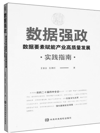
《数据强政:数据要素赋能产业高质量发展》王金合 彭艳玲 著 中共中央党校出版社

一系列打拐努力与成效有目共睹,但反拐打拐工作依然任重道远。一方面,我们要看到受害家庭所经历的创伤仍难以完全抚平,他们或因孩子被拐而变得支离破碎,或为寻找孩子付出了巨大代价,或是认亲成功也未能团圆,或是团圆后曾经的被拐者仍与家人较为疏离,社会还需对这些家庭给予适当的帮扶和干预。另一方面,我们要认识到,反拐打拐远未到鸣金收兵之时,只要有孩子在流浪,还有家庭在守望,打拐之战就一刻不能停歇。如何进一步利用人工智能、人脸识别、基因技术等前沿科技,构建起全方位、立体化的儿童保护网络,或是未来反拐打拐工作更应聚焦的方向。