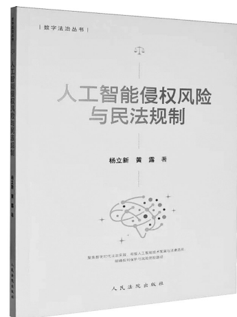
《人工智能侵权风险与民法规制》杨立新 黄露 著 人民法院出版社

未成年人是国家的未来,预防和治理未成年人犯罪是守护成长底线、筑牢社会安全屏障的核心命题。本书以“六大保护”责任主体的权责及法律依据为基本单元,系统梳理我国未成年人犯罪预防和治理的刑事政策和法律法规体系,收录了最新修订的未成年人保护法、治安管理处罚法等,每个领域后面附有典型案例以增强实用性,既适用于从事涉未成年人案件办理的法官、检察官、公安干警、律师等司法人员,也适用于从事未成年人保护的六大领域责任主体以及法学、社会学研究者。