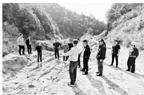
2024年4月,太湖县汤泉乡人大组织乡两级人大代表走访调研水源地选址工作。

如果说运动场的改造关乎孩子们的成长,那么饮水工程的推进则牵动着全乡百姓的心。过去,在汤泉乡不少行政村存在用水量不足、水质差等问题。每到雨季,山洪裹挟泥沙涌入水渠,村民家中水龙头流出的水浑浊发黄,需要静置半天才能勉强使用;而一到旱季,山泉水源干