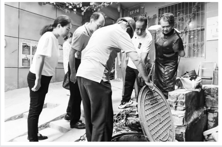
人大代表协调推进解决居民区下水管网堵塞问题。