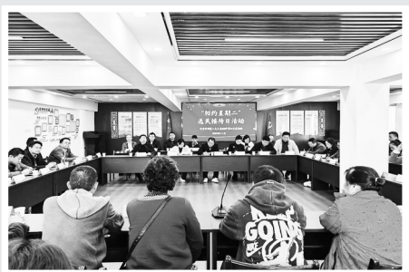
2023年11月,黄石港区人大常委会开展“相约星期二”代表接待选民活动。