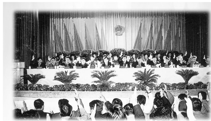
1998年3月23日,浙江省洞头县十届人大一次会议表决通过《关于自力更生、艰苦创业,集资投资建设五岛相连工程的决议》。

督质量、解难题;代表们走村入户动员,凝聚起全民共建合力。机关干部带头捐款,渔民农民自发投劳,在外企业家慷慨解囊,涓涓细流汇聚成建桥洪流。1996年12月29日,五岛相连工程正式开工;2002年5月30日,工程全线贯通,深门、花岗、状元岙等7座大桥串联本岛、霓屿等5个住人岛,孤岛首次牵手成半岛。通车当天,岛上万人空巷,群众扶老携幼奔赴现场,共同见证这一历史性时刻。五岛相连圆梦,半岛征程再启。2003年4月,温州(洞头)半岛工程开工建设,人大接续监督推动提速提质。2006年4月29日,全长14.5千米的灵霓北堤正式通车,中国第一跨海大堤横卧碧波,洞头告别千百年与温州隔海相望的历史,迈入半岛时代。通车次日,时任浙江省委书记习近平发来贺信,充分肯定工程重大意义。通车当天,洞头签约10.17亿元引资大单,天堑变通途,为海上花园建设打通关键命脉,海岛发展从此驶入快车道。