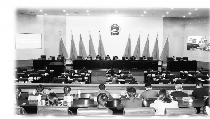
2023年4月27日,浙江省温州市十四届人大常委会第十一次会议通过《温州市人民代表大会常务委员会关于促进和保障洞头海上花园建设的决定》。