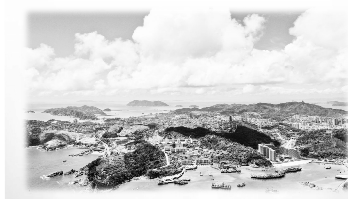
如今,万顷碧波之中的海岛明珠,不仅闪耀着山海之美,也讲述着洞头人谱写“海上花园”新篇章的奋斗故事。